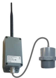
SU11 - 6/4" ULTRAZVOČNI SENZOR