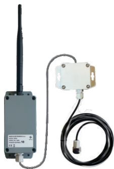
SC10/R - KAPACITIVNI SENZOR