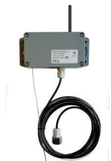
SC10 - KAPACITIVNI SENZOR